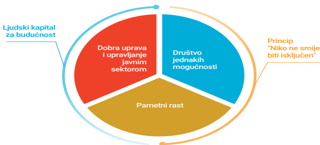
Slika 2. Vizuelni prikaz razvojnih procesa