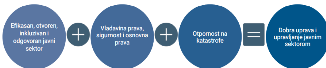
Slika 3. Prikaz esencijalnih akcelatora u procesu