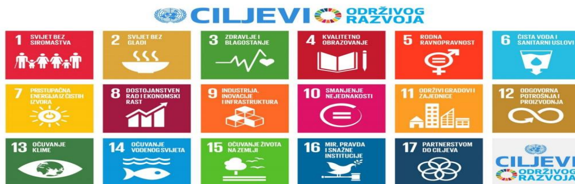
Slika 1. 17 ciljeva održivog razvoja (SDG)